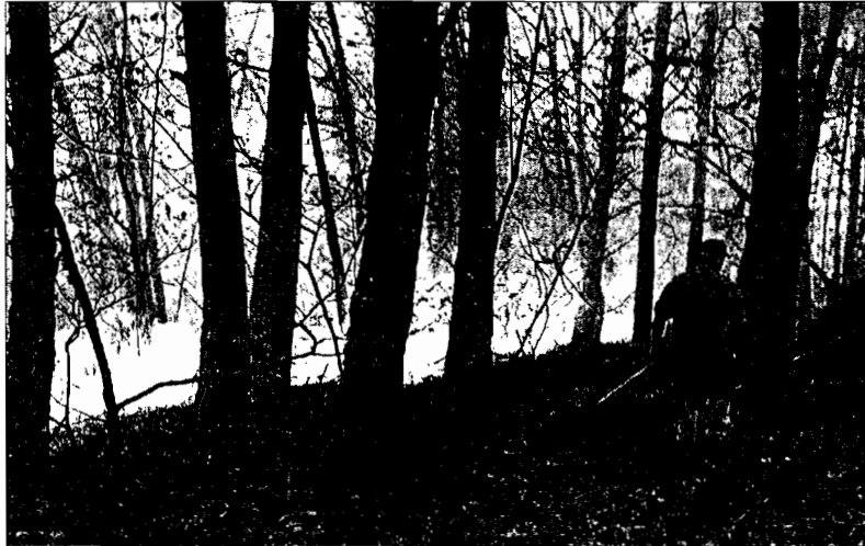
Brigadistas trabajan el pasado 8 de abril en el incendio de Bande que arrasó 410 hectáreas.