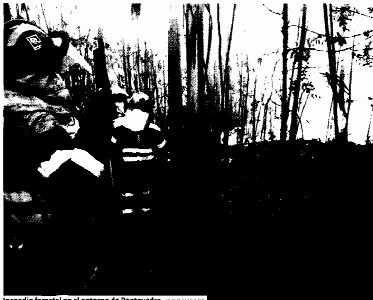
Incendio forestal en el entorno de Pontevedra. JAVIER CERVERA

► Los biólogos gallegos defienden frente a la química, la limpieza de los bosques para evitar que el fuego acabe con la riqueza forestal