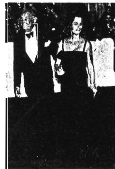
De la Renta junto a Cruz.

Este año ofrece una exposición en homenaje al desaparecido diseñador británico Alexander McQueen. Una de las más esperadas fue la actriz Penélope Cruz, que llegó al Met cogida del brazo del diseñador Óscar de la Renta. Se dejaron ver también Beyoncé, Gwyneth Paltrow y Jennifer López.