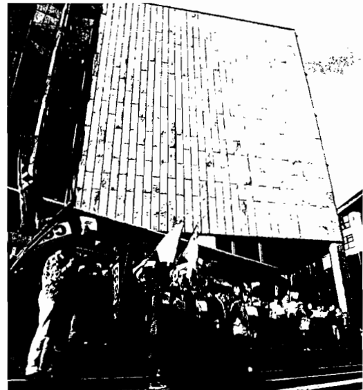
Los trabajadores se concentraron ante los juzgados. CÉSAR QUIAN

De este modo, Varela le expuso a Cortizo algunos trabajos realizados por la Fiscalía Superior relacionados con los incendios forestales, la contaminación de los residuos ganaderos o la trata de mujeres con fines de explotación sexual. Así pues, señaló, en relación a este último punto, que «estamos actualizando ese protocolo, e asinarémolo en breve como consecuencia da reforma do Código Penal». Varela invitó a la Delegación del Gobierno a la firma de este documento. Además animó a Miguel Cortizo a estar presente el próximo 7 de junio en la presentación de un trabajo de diagnóstico del furtivismo en Galicia. Se trata «dun documento importante para que tódalas institucións implicadas, de maneira coordinada, teñamos un diagnóstico claro de toda esta problemática».