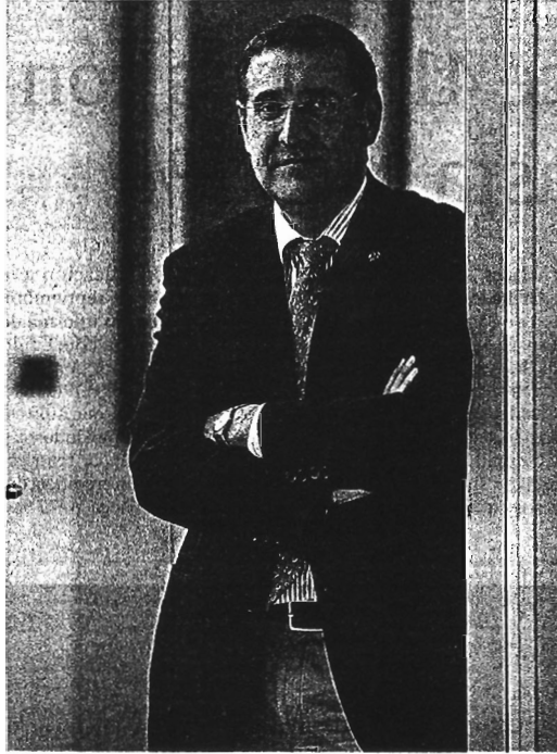
Patiño asegura que las inversiones de REE van a buen ritmo.

—Se han previsto unos índices de crecimiento de entre un 1 y un 2 %. Hace un año se revisó la planificación y se optó por retrasar aquellas instalaciones