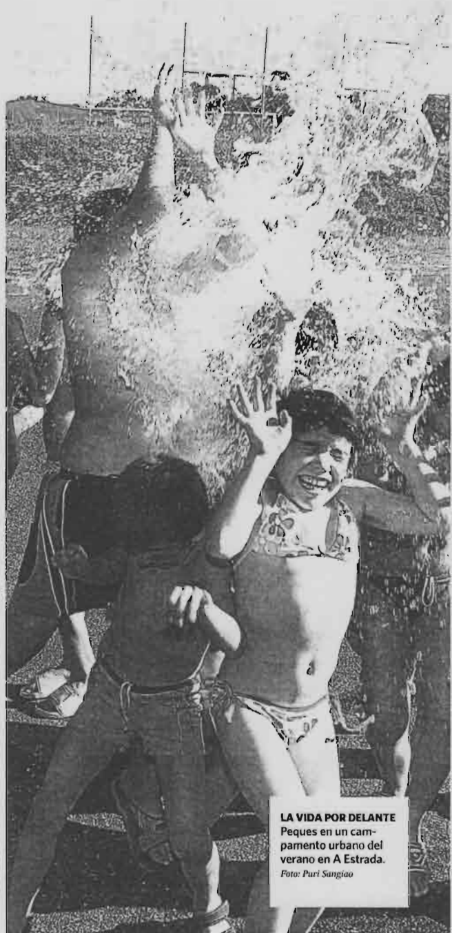
LA VIDA POR DELANTE Peques en un campamento urbano del verano en A Estrada.

“O adolescente non pode someterse todo o tempo ó estudo e ó control, coma se tivese doce anos. Sen liberdade se rebelará”