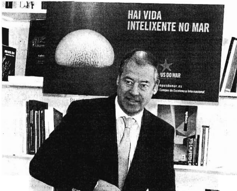
El rector vigués, con el cartel del Campus do Mar, que preside su despacho.

La Universidad de Vigo confía en obtener ese marchamo y la financiación que lo acompaña del Ministerio de Educación, pero también tiene claro que "si no fuera así, vamos a seguir adelan-