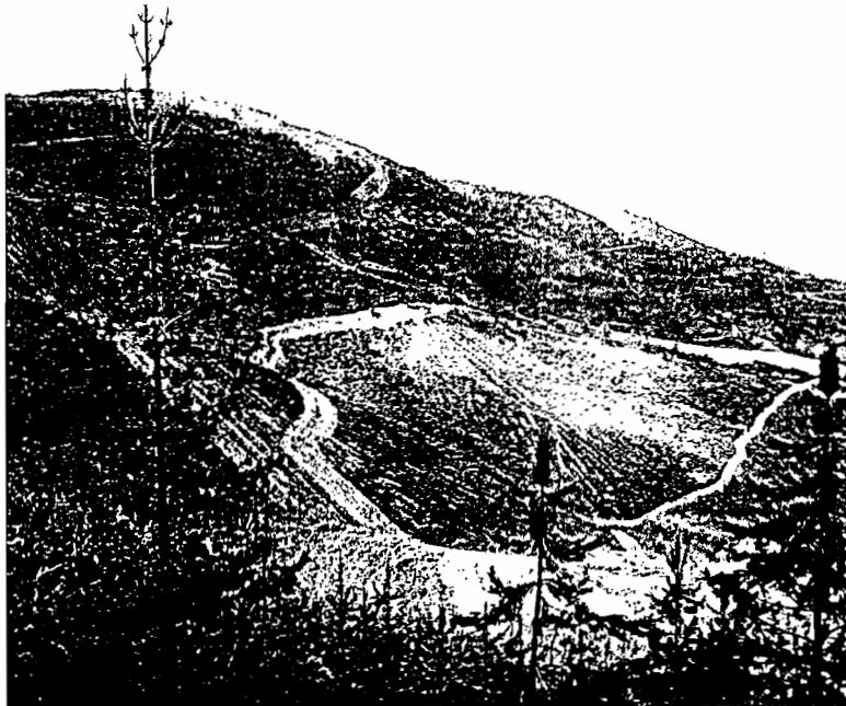
Repoboación de piñeiros, pistas e cortalumes, unha estampa habitual nos montes do Courel