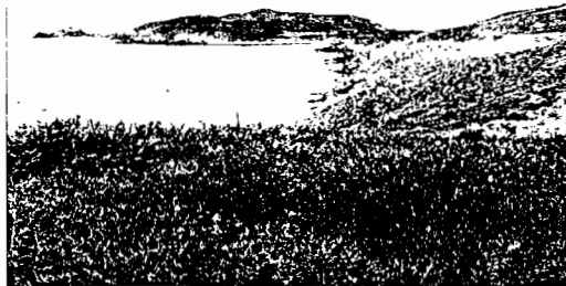
O Cabo Touriñán segue a ser o punto de discordia entre os grupos

A reforma da Lei do solo será aprobada no Parlamento o vindeiro martes cos votos a favor do PPdeG e PSdeG. Tras este paso, "correspóndelle á Xunta aplicar a lei e avaliar proxectos dentro das directivas europeas. Iso é o que faremos, en Touriñán e en calquera outro caso", advertiu o máximo mandatario galego na rolda de prensa posterior ó Consello da Xunta. O presidente