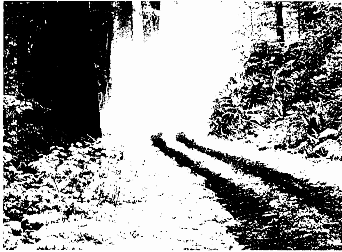
Os bosques están ameazados polo paso de carreteras, extracción de madeira e os encoros, entre outros.

A EMPRESA LUCENSE DE TABOADA CASA MACÁN ELABORA O ÚNICO QUEIXO BAIXO EN LACTOSA DE GALICIA QUE CHEGA A TODO O MERCADO NACIONAL GRACIAS AS CADEAS DE DISTRIBUCIÓN. NO SEU AFÁN DE MELLORA E INNOVACIÓN TEN PREVISTO COMERCIALIZAR UNHA FONDUE DE QUEIXO FEITO A PARTIRES DE VARIETADES GALEGAS.