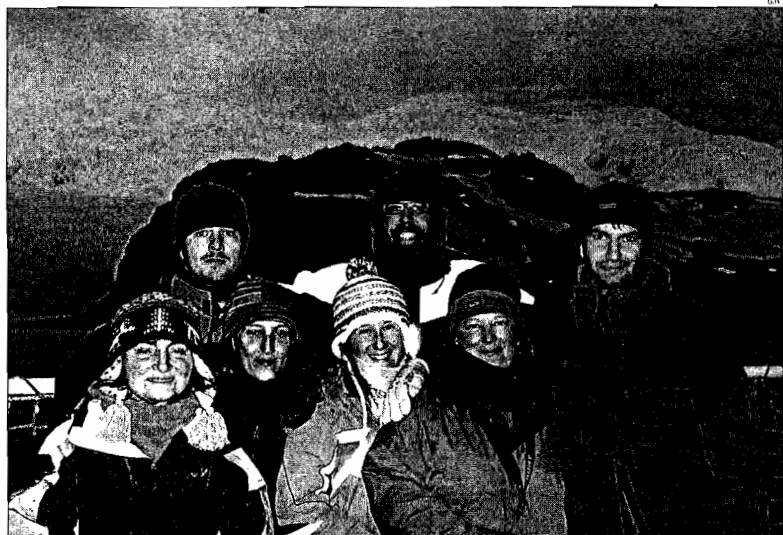
Fotografía de grupo de parte dos investigadores da UVigo no Hespérides coa illa Livingston ao fondo

A INSTITUCIÓN OLÍVICA CONFÍRMASE COMO UNHA DAS QUE MÁIS EXPERTOS ACHEGA Ó PROXECTO