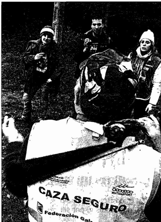
Uno cazador, hablando con tres ecologistas.

Varios agentes participaron en las tareas de vigilancia para mantener separados a cazadores y grupos ecologistas. El campeonato discurre en los alrededores, en unas 100.000 hectáreas de monte de los municipios de Guntín, Taboada, Portomarín, Paradela, Sarria, Lugo, O Corgo y Monterroso, respaldada por la Federación Gallega de Caza, que asegura que en Galicia hay un exceso de zorros. El presidente de la citada Federación, José María Gómez Cortón, alegó que en Galicia hay 2,7 zorros por kilómetro cuadrado, cuando las organizaciones europeas defensoras de la fauna salvaje señalan que ese índice no debería superar 0,7 animales