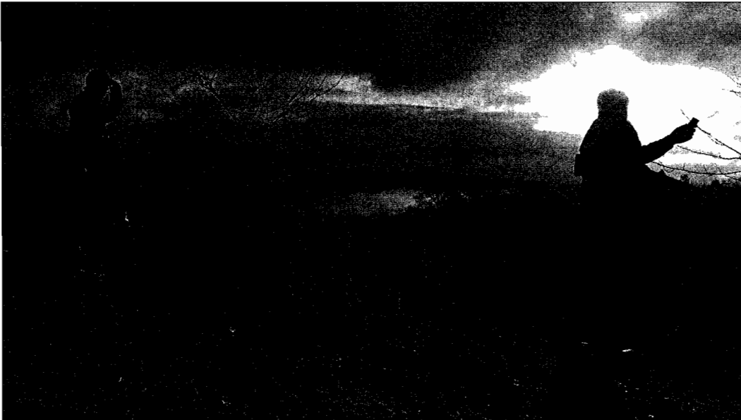
Dos de los participantes en la VII Copa de España de caza de zorro, ayer, en los montes de Portomarín.

Ya es un clásico. El torneo estatal de caza de zorro, que se celebró ayer en Portomarín (Lugo) volvió a convertirse, por cuarto año consecutivo, en un careo entre cazadores y eco-