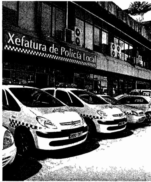
Imagen de la Jefatura de la Policía Local de Vigo

Según el cuerpo municipal, el objetivo para el 2010 "es mantener bajo control las calles con los resultados consolidados en el 2009 y, paralelamente, localizar nuevos puntos negros en los que los conductores circulan a velocidades excesivas y ello supone un riesgo para la seguridad vial". Para dar con esas zonas, los agentes solicitan la colaboración ciudadana. ■